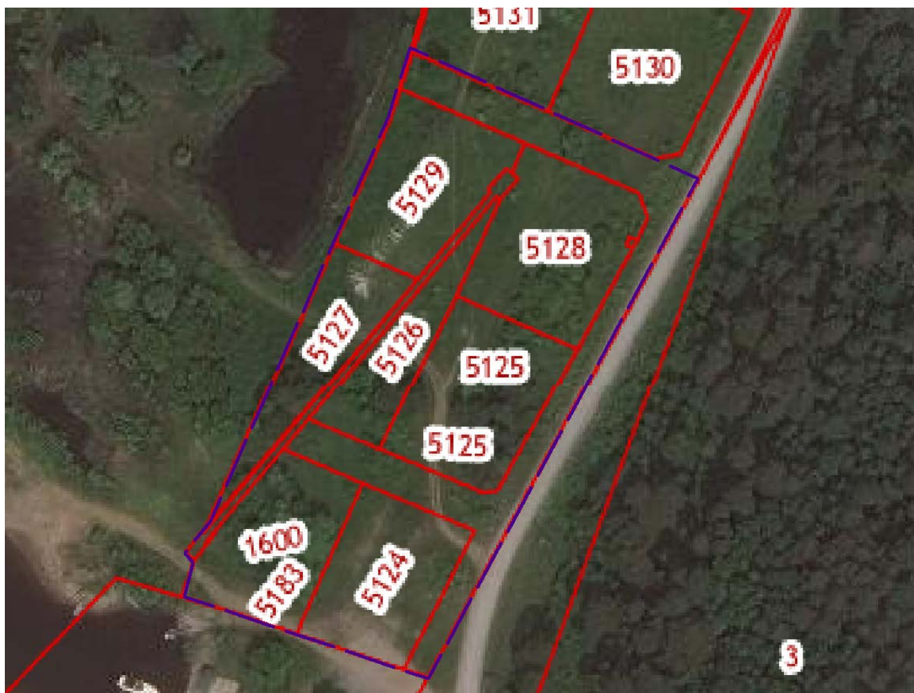
Схема для разработки проекта межевания части территории с. Усть-Качка Усть-Качкинского сельского поселения Пермского муниципального района Пермского края, включающей земельные участки с кадастровыми номерами 59:32:1950001:5126, 59:32:1950001:5183, 59:32:1950001:5128, 59:32:1950001:5127, 59:32:1950001:1161